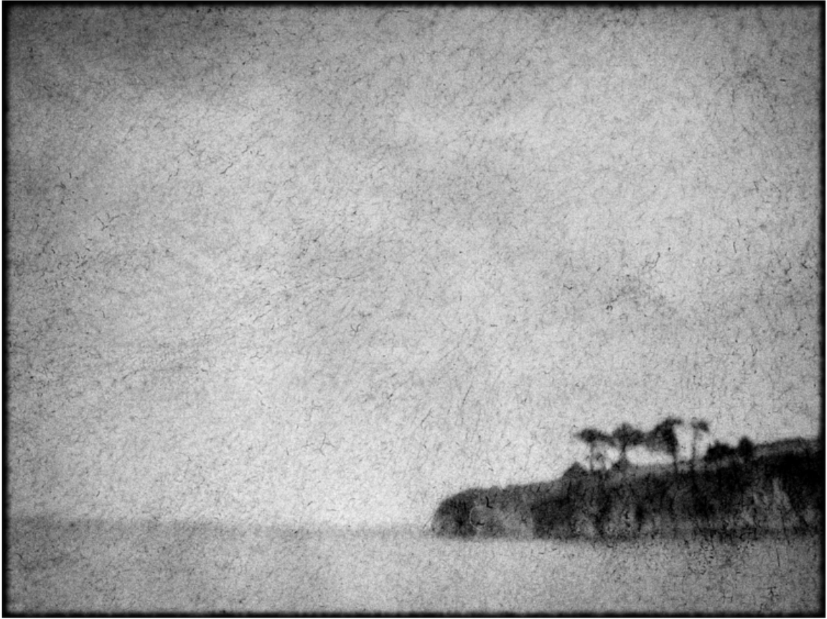
« La falaise du Ris »