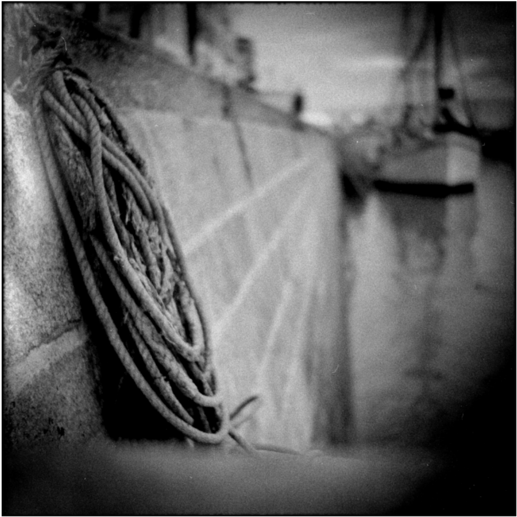
« Le bout »