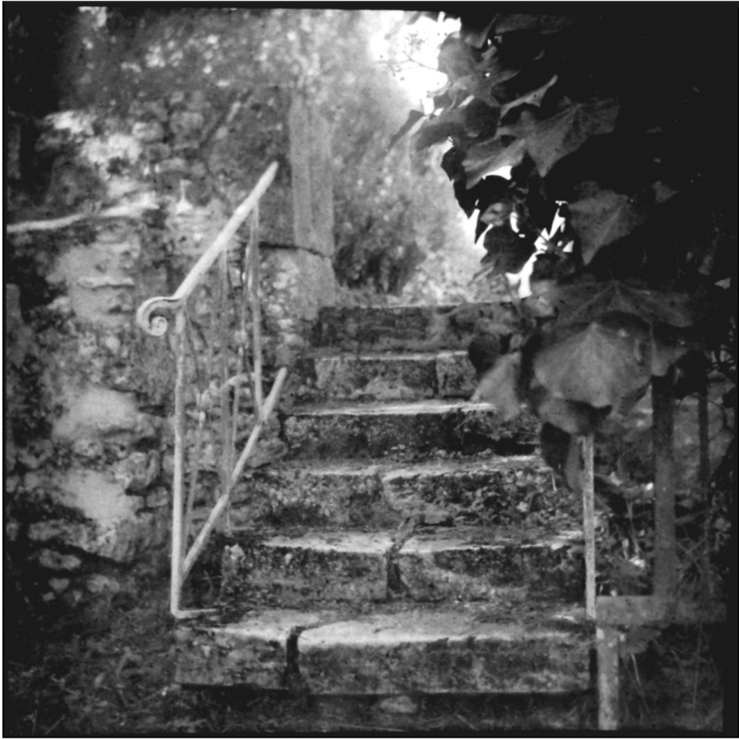
« Les vieilles marches »