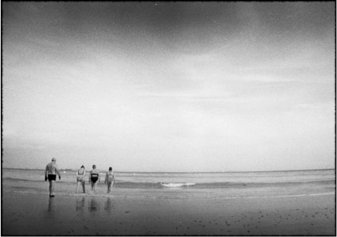
« La brochette »