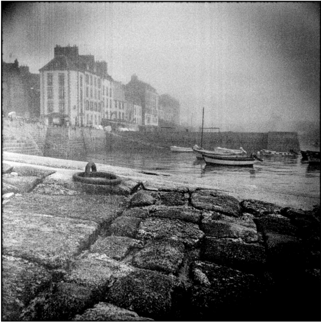
« Le rosmeur »