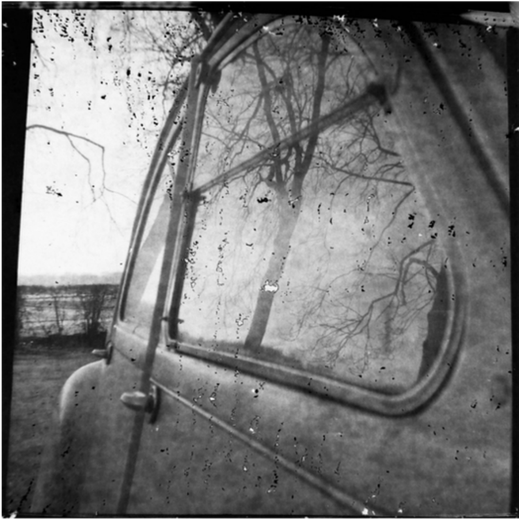
« Mécanique chevaline »