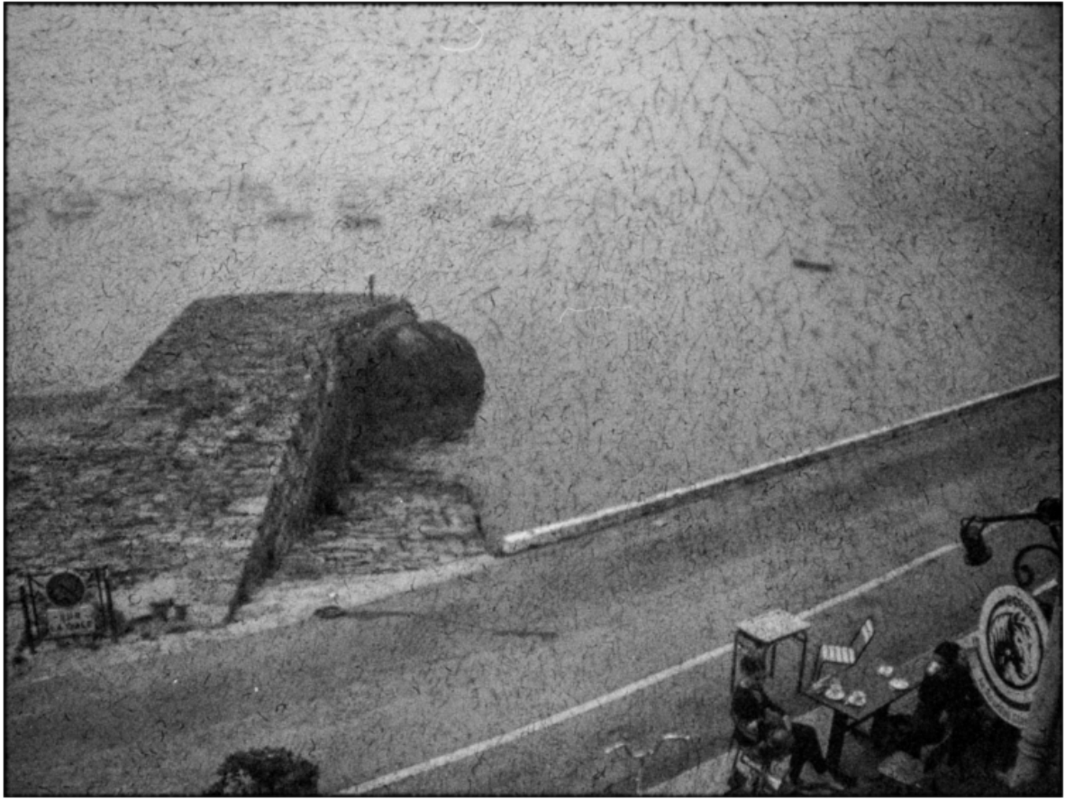
« La cale raie des filets bleus »