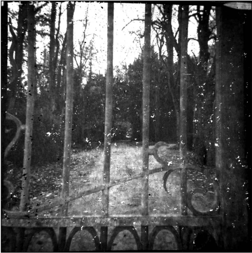
« Après la grille »