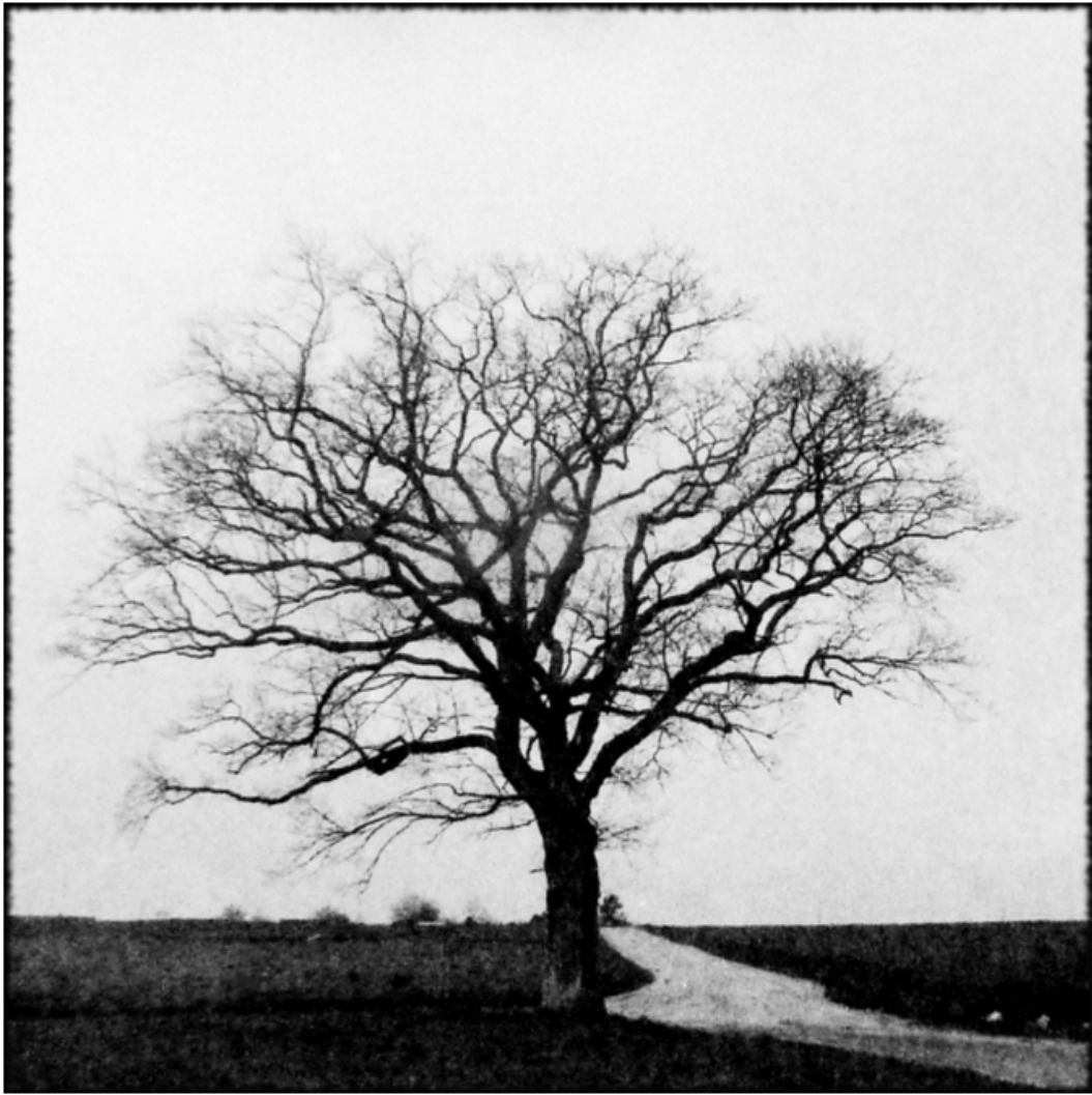
« L'arbre seul »