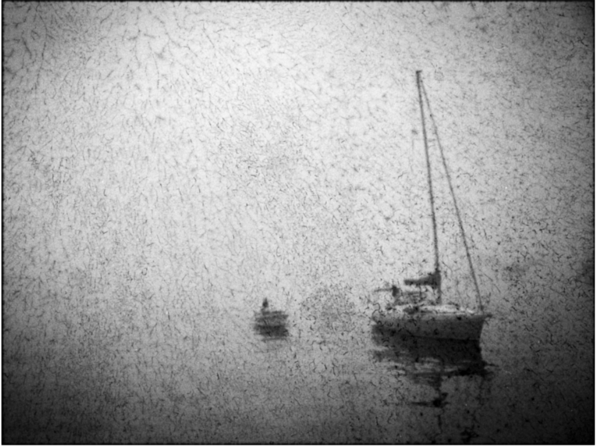
« Bateaux, fantômes »