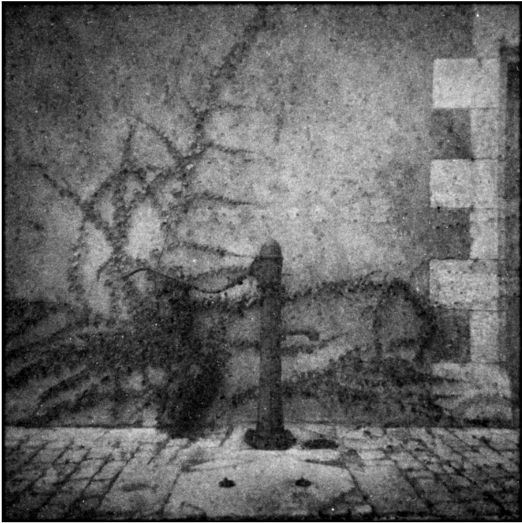
« La fontaine »