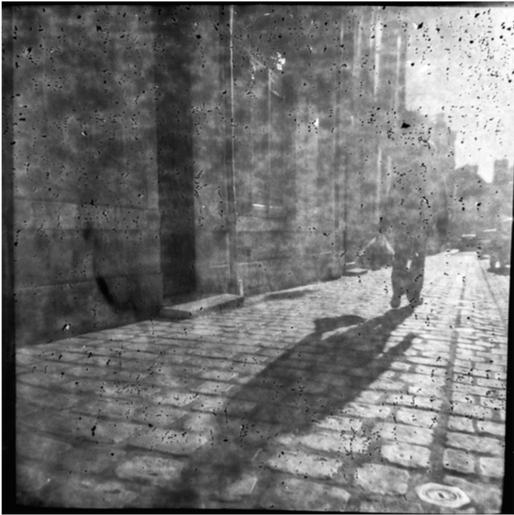
« L'ombre portée »