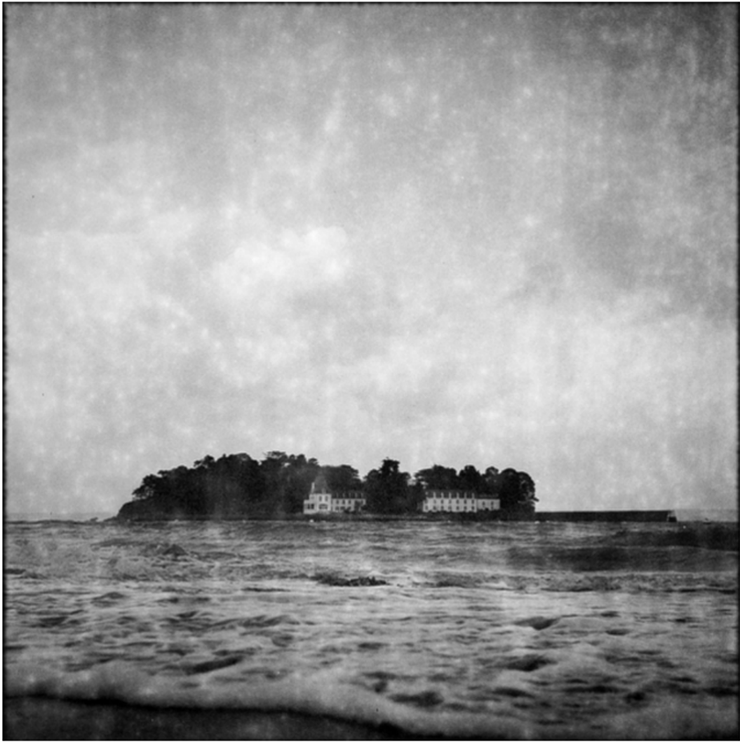
« L'île Tristan »