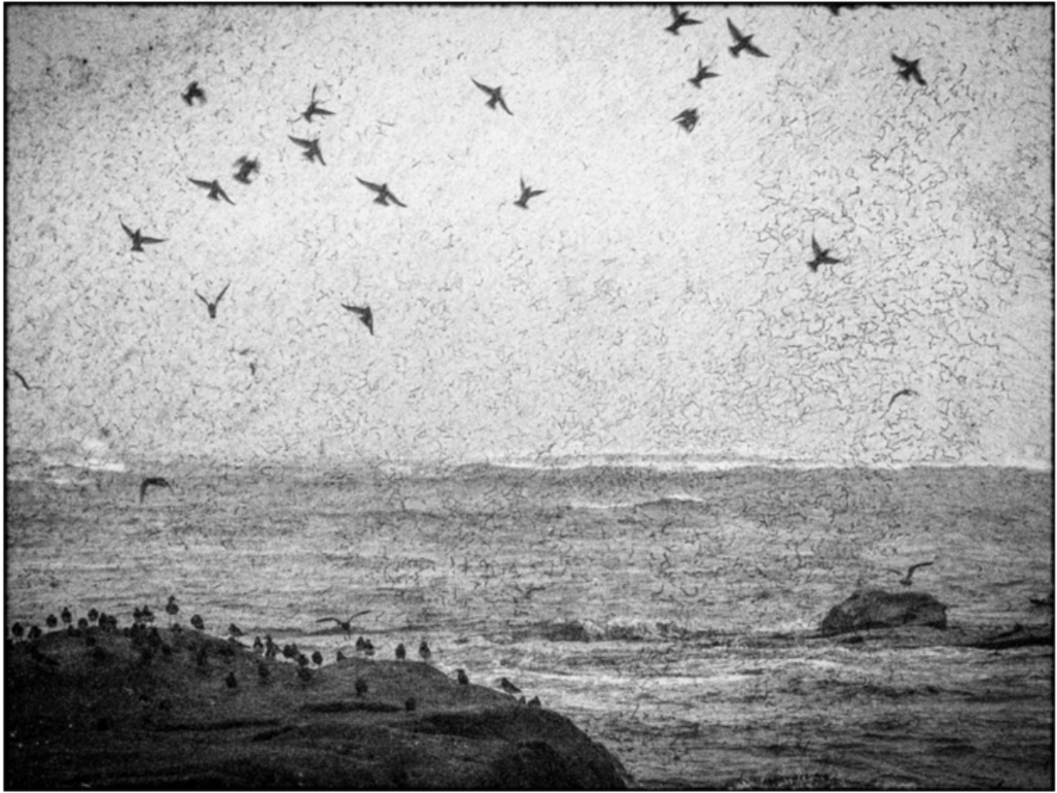
« Les choukas n°2 »