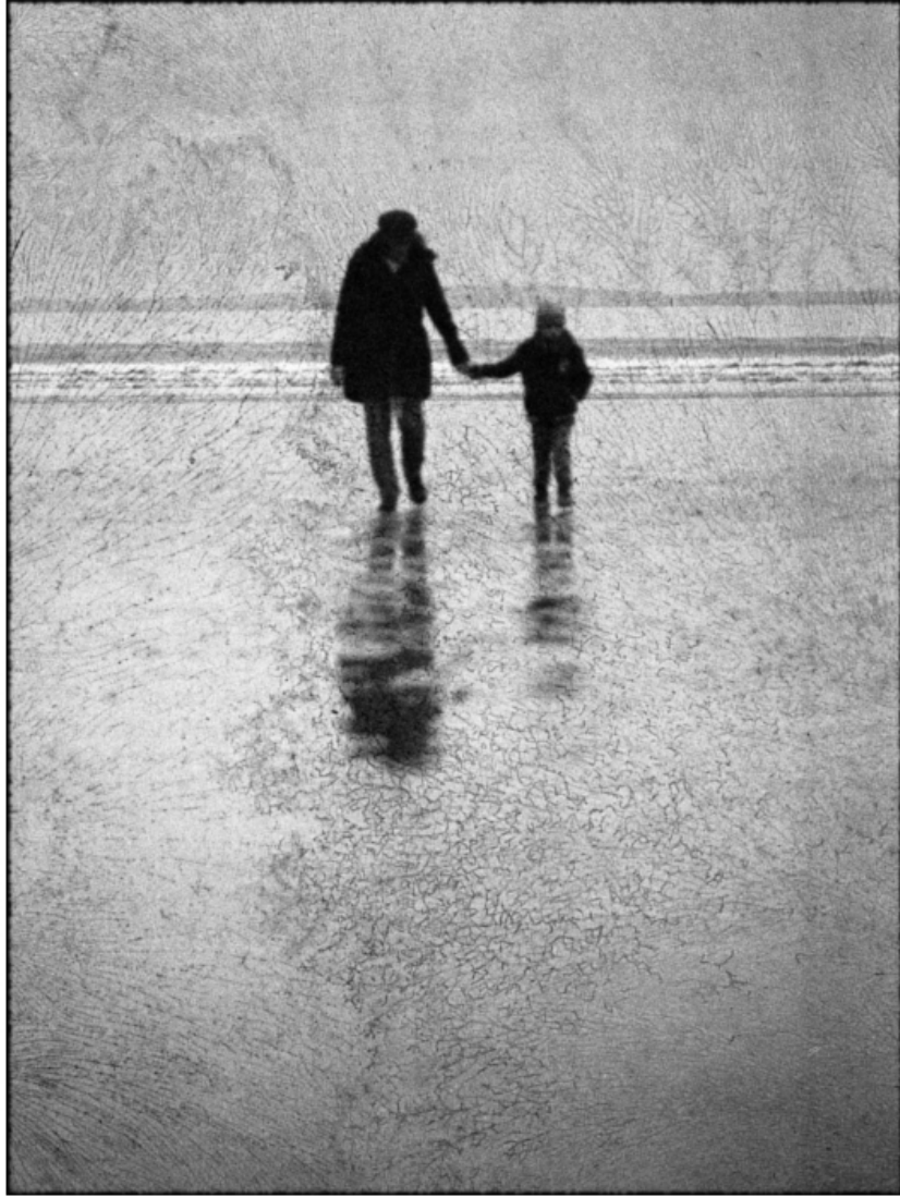
« La promenade n°2 »