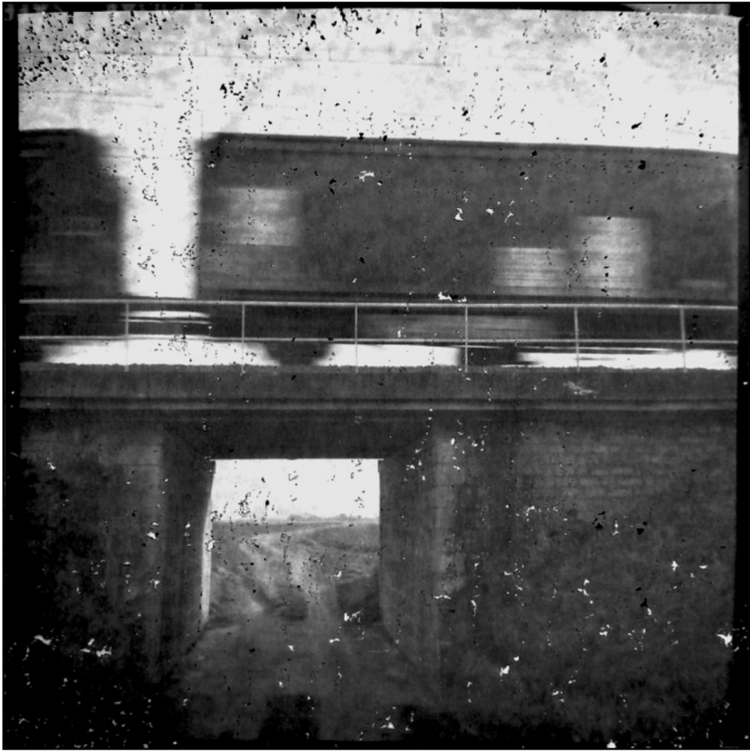
« Un train d'enfer »