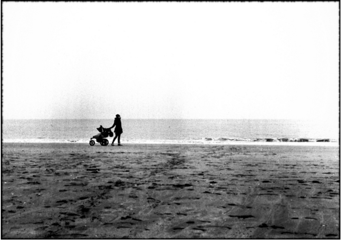
« La promenade »