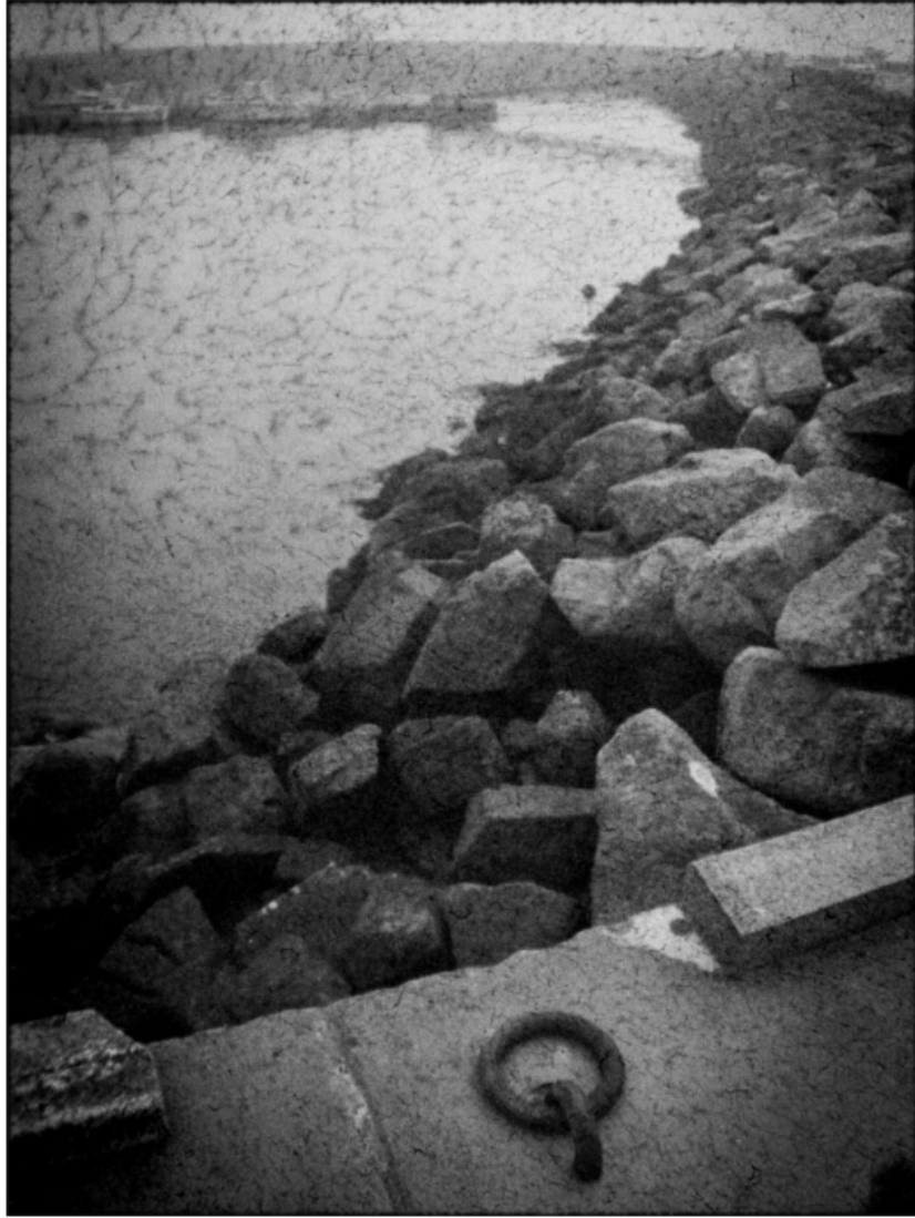
« L'anneau de la digue »