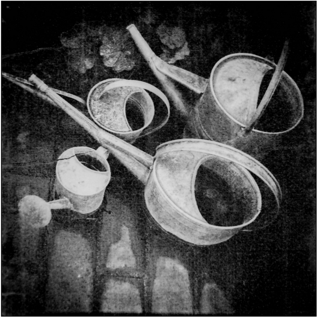
« Les arrosoirs de madame Soupiron »