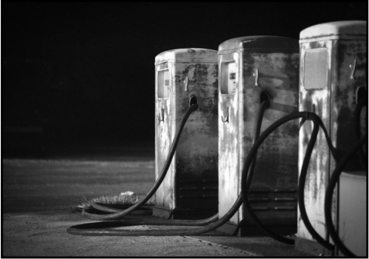
« Vieilles pompes »