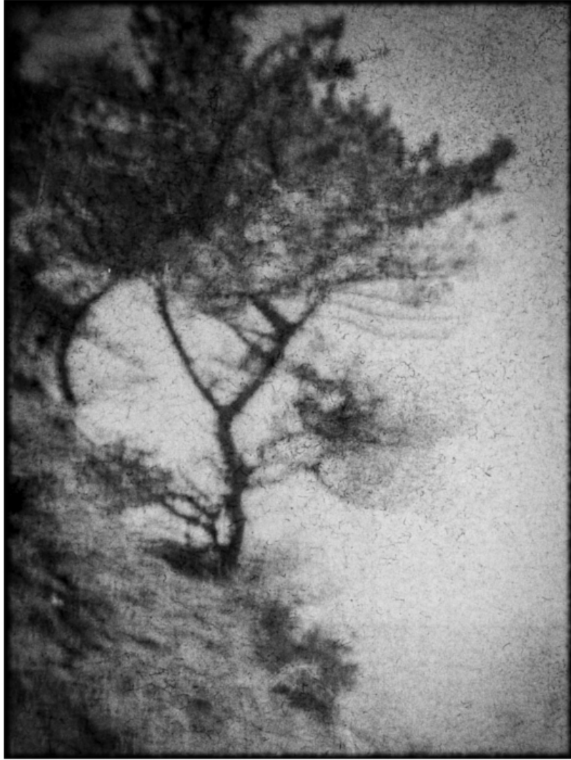
« À flanc »